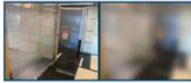
フォーカスチェンジ